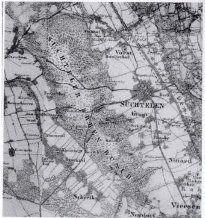
Titelseite der Publikation Süchtelner Erbenbusch

auch die Volksfrömmigkeit mit der „Irmgardis-Kapelle“ und der sog. „Irmgardis-Oktav“ im September sind bis heute eine besondere Nutzung in unserem Stadtteil und darüber hinaus